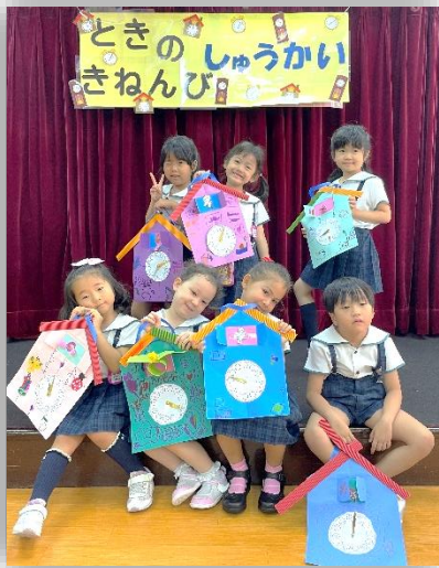
ときのしゅうかい きねんび